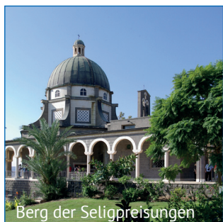
Berg der Seligpreisungen