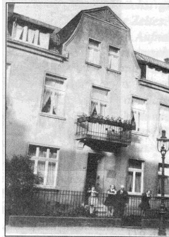
Foto: Das Elternhaus in Kleve, das Familie Leisner vor 90 Jahren bezogen hat. Wie die anderen Schwarz-Weiß-Fotos entnommen aus: Hans-Karl Seeger u. Gabriele Latzel (Hg.), Karl Leisner. Tagebücher und Briefe. Eine Lebens-Chronik, 5 Bände, Verlag Butzon & Bercker GmbH, Kevelaer, 2014

Fahrt zum Schönstattzentrum Oermter Marienberg. Pilgerweg von der „Sonsbecker Schweiz“ nach Kevelaer. Hl. Messe im Marienwallfahrtsort, Abendessen und Konveniat im Priesterhaus.