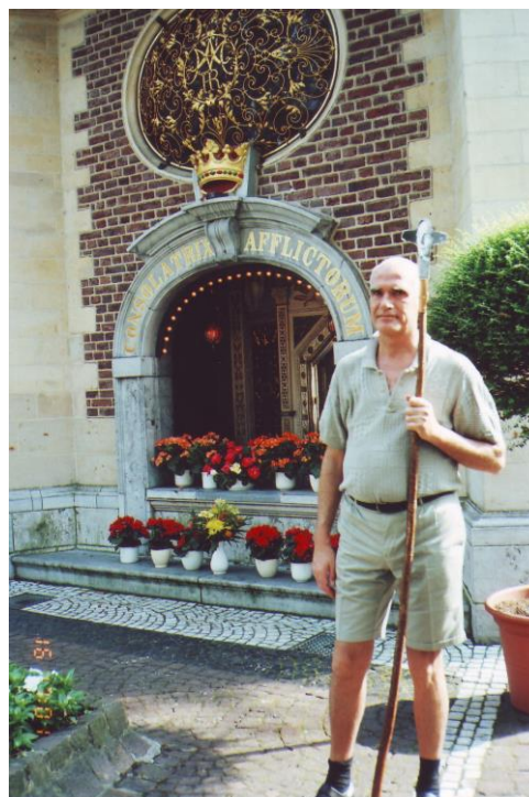
Foto: Vor der Gnadenskapelle in Kevelaer