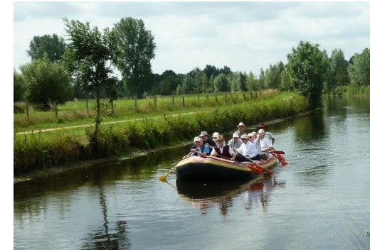
Farbfotos: private Aufnahmen von Pilgermärschen der vergangenen Jahre, hier mit dem Schlauchboot auf der Niers zwischen Schloss Wissen und „Jan an de Fähr“

Fahrt im Schlauchboot auf der Niers von Schloss Wissen bis „Jan an de Fähr“.