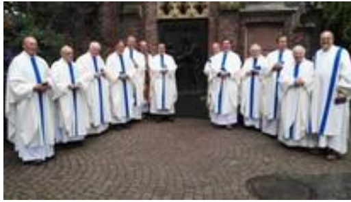
Gruppenbild vor dem Portal der Versöhnung in Kevelaer, 2017

Die schönstättischen Priestergemeinschaften laden Priester, Priesteramtskandidaten und Diakone zum 20. Pilgermarsch auf den Spuren des seligen Karl Leisner am Niederrhein ein. Im Jubiläumsjahr „100 Jahre Apostolischer Bund von Schönstatt“ und „75 Jahre Priesterweihe“ stehen die Tage unter dem aktuellen Leitwort der Internationalen Schönstattfamilie. Täglich gibt es geistliche Impulse, Austausch, Stundengebet, Rosenkranz und Hl. Messe, Freizeit, Gebet um Priesterberufungen und Fußwege zwischen 10 und 15 km (mit Transfer, d.h. Anreise nach Kevelaer mit der Bahn möglich).